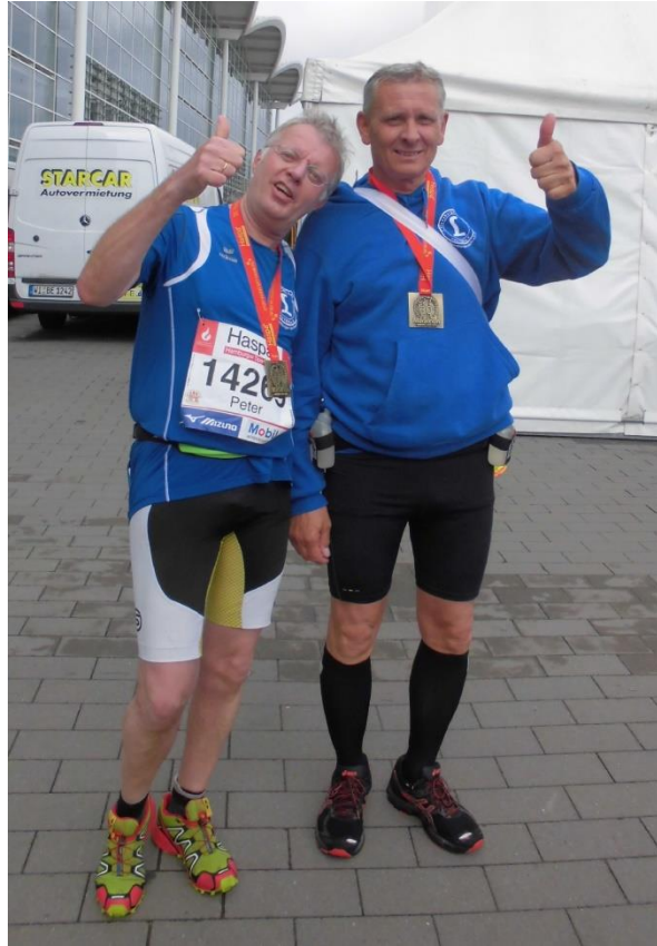
Peter und der Wolf